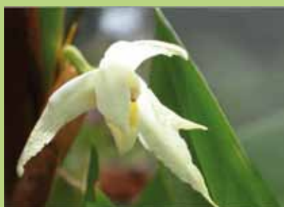
Riserva Karen Mogensen