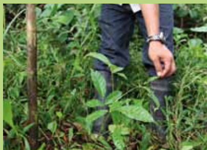
Riserva Amistad Caribe