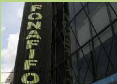
Sede Fonafifo - San José

lati 1.127.840 mq di foresta. Nella Riserva Amistad Caribe, che è la più estesa del Paese, sono stati effettuati dal 2004 interventi di rigenerazione e conservazione di ulteriori 9.919.800 mq di foresta. Impatto Zero® ha attuato interventi in Costa Rica per una superficie complessiva pari a 11.047.640 mq.