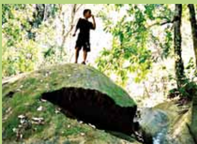
Riserva Karen Mogensen